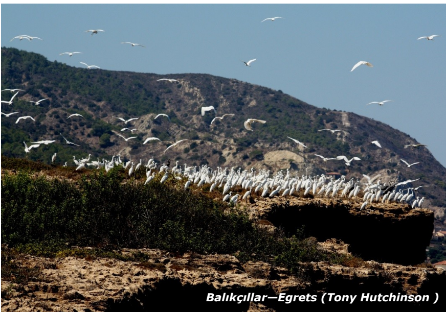
Balıkçılar—Egrets (Tony Hutchinson)

The Important Bird Area (IBA) team at BLC and KUŞKOR wish to express their gratitude to all of those taking part for giving up their Sunday mornings. Never before has such an organised island wide survey taken place and the results are extremely pleasing. The survey, the first of its kind for Cyprus is to be repeated next season and its results (together with data from spring surveys) will