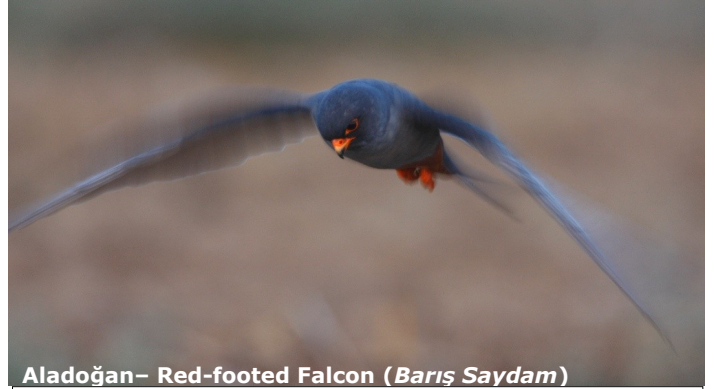
Aladoğan– Red-footed Falcon (Barış Saydam)

Eğer 2011 Sonbahar dönemi araştırmasında yer almak istiyorsanız info@kuskor.org adresinden bize ulaşabilirsiniz.