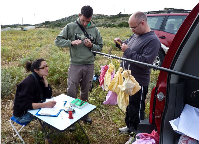
Kuşkor halkalama grubundan bazıları Some of the KUŞKOR ringing group

Ringing under the KUŞKOR ringing scheme continued in 2010. Trapping and ringing, which was supervised by a qualified ringer, is when a uniquely-numbered metal ring is placed on a bird's leg and the bird is released. It took place in the Karsiyaka area in both spring and late summer, Sadrazamköy and Geçitöy Gölü. A new ringing site was opened up on the Mesoria Plain.