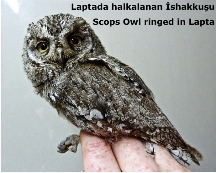
Laptada halkalanan İshakkuşu Scops Owl ringed in Lapta

Ringing under the KUŞKOR ringing scheme continued in 2010. Trapping and ringing, which was supervised by a qualified ringer, is when a uniquely-numbered metal ring is placed on a bird's leg and the bird is released. It took place in the Karsiyaka area in both spring and late summer, Sadrazamköy and Geçitöy Gölü. A new ringing site was opened up on the Mesoria Plain.