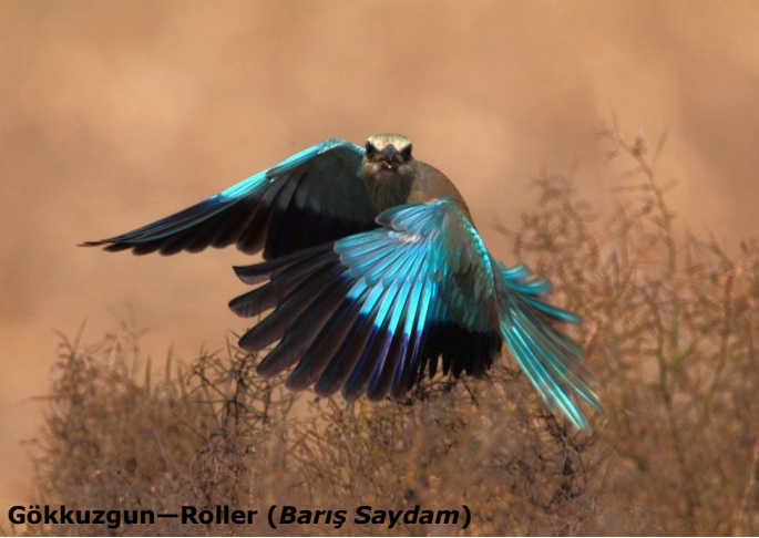
Gökkuşgun—Roller (Barış Saydam)

27 Kasım 2010 günü Bellepais Manastır'ı KUŞKOR 'un ilk yaban hayatı fotoğraf sergisine ev sahipliği yaptı. Bu sergideki eserler Kıbrıs'ın dört bir yanından hem profesyonel hem de amatör fotoğrafçılara aitti. KUŞKOR ekibinin sergi için gönderilen fotoğraflar arasından seçim yapması çok zor oldu. Serginin planlaması, sergi alanının düzenlenmesi ve sergilenmek üzere 130 fotoğrafın belirlenmesi haftalarca süren bir hazırlık gerektirdi. İki gün süren etkinliği 400'den fazla kişi ziyaret etti. Bu serginin gerçekleştirilmesine destek olan ve basım masraflarını karşılayan KKTC Kültür ve Turizm Bakanlığı'na derneğimiz adına çok teşekkür ederiz. KUŞKOR 2011 yılında Lefkoşa ve Gazi Mağusa'da da bu tarz sergiler düzenlemeyi planlamaktadır. Sergide kullanılan on üç fotoğraf, KUŞKOR ofisinde ve birçok dükkânda bulabileceğiniz, 2011 KUŞKOR takviminde de kullanıldı. Fotoğraflarını bizlerin kullanımına hiçbir maddi kazanç gütmeyen sunan doğa fotoğrafçılarına sonsuz teşekkürler.