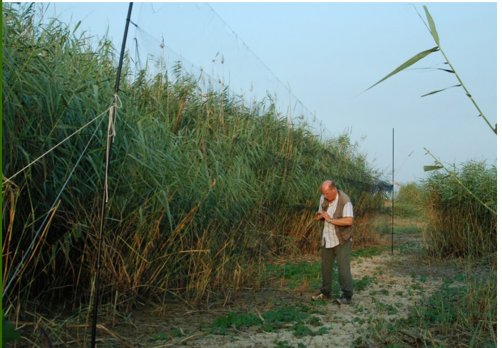
Mesarya'daki çalışmalar sırasında Clive Walton (2010) Clive Walton at the ringing site in Mesarya (2010)