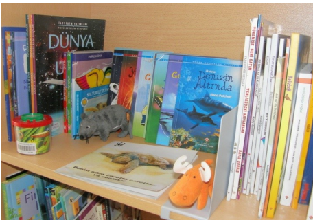
Some of the books available in CNL's kiddies corner.