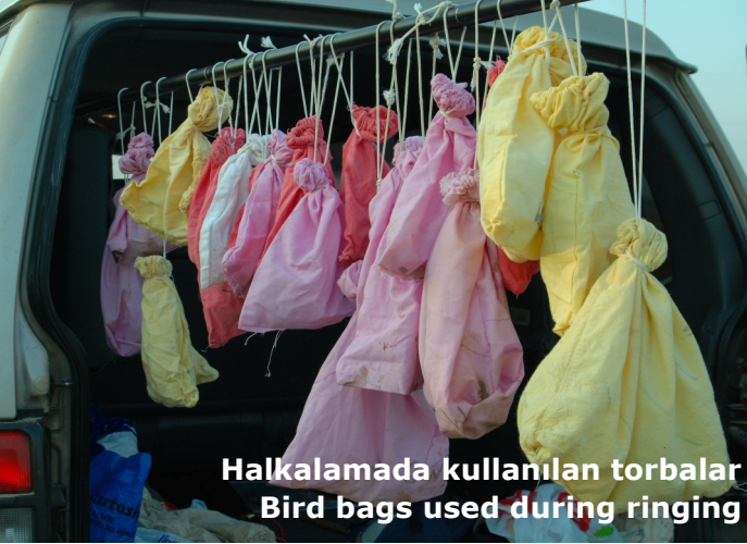
Halkalamada kullanılan torbalar Bird bags used during ringing

Bu yıl da geçen yıllarda olduğu gibi halkalama çalışmaları Geçitköy Göleti ve Sadrazamköy'de ilkbahar ve sonbaharda gerçekleştirildi. Fakat, bu yıl geçen yıllara ek olarak çalışmalara Mesarya Ovası'nda, Balıkesir yakınlarında, yeni bir halkalama sahası eklendi.