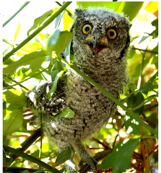
İshakkuşu —Scops Owl (Jean Clark)

After half a decade of dormancy KUŞKOR breathed a new breath of life in January 2010. With the help of a grant from the EU, our office in Kyrenia was re-opened to form the hub of a bi-communal project, which, in partnership with Birdlife Cyprus, aims to update the Cyprus Important Bird Area (IBA) inventory. In 2004 Birdlife Cyprus produced an inventory of 19 IBAs for Cyprus but as data was lacking for North Cyprus, only two IBAs were identified in the Turkish community. Now KUŞKOR biologists with coordination from Birdlife Cyprus and with help from a team of voluntary ornithologists from both communities, have completed the first year of surveys to provide much needed bird data for North Cyprus. The team are undertaking surveys in Koruçam Peninsular, Mesarya Plain, Beşparmak Mountains and Karpaz Peninsular. The data gathered in this project will provide governmental departments with guidance they need for conservation planning.