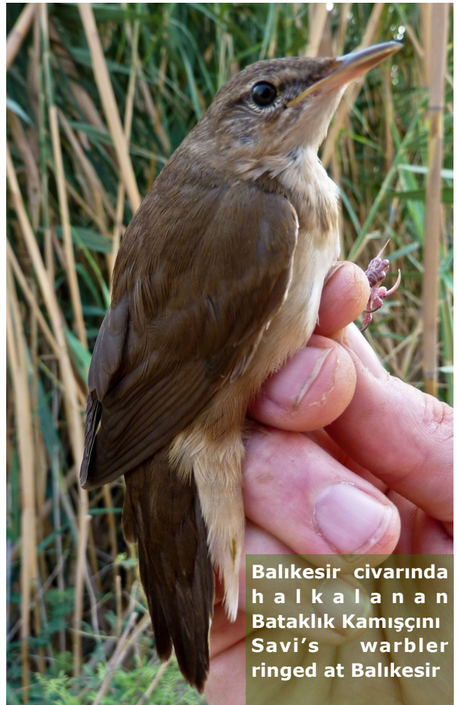
Balıkesir civarında halkalanan Batalık Kamışçını Savi's warbler ringed at Balıkesir

Spanish Sparrow and Red-rumped Swallow were also ringed at Sadrazamköy, but particular interest was generated by a new Mesoria Plain